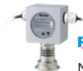
PRESS THERMO NSMS-A6VB-T PAT.