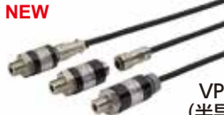
VPNPR/VPNPG (半导体应变式输出)