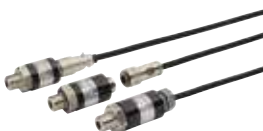
VHR3/VHG3 (半导体应变式输出)