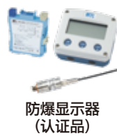
防爆显示器 (认证品)