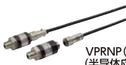
VPRNP (IS) 防爆用 (半导体应变式输出)