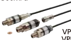
VPRT (F) VPRQ (F) (应变式输出) ※有防爆