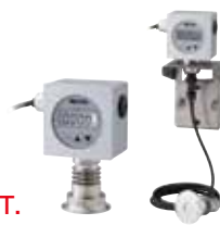
带背光 NSMS-A6VB/ NSMS-A6VB分立式