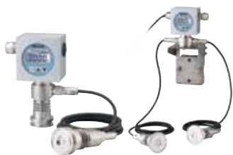
带背光 VSD4 PAT.