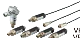
VPRT (F) VPRQ (F) (模拟输出)