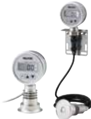
带背光(选配) HSSC-A6V(B)/ HSSC-A6V(B)分立式