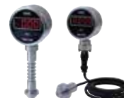
均质机用 HSSC-A6/ HSSC-A6分立式